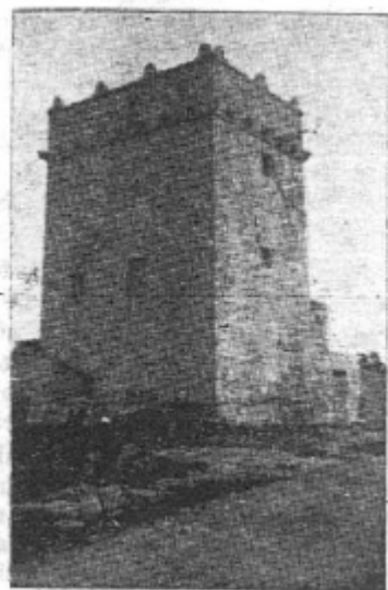
Torri Santa Ċilja